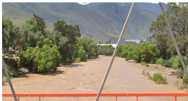
Se observa una acumulación significativa de sedimentos y material arrastrado por la corriente, lo que reduce la capacidad hidráulica del río y aumenta el riesgo de desbordes en épocas de lluvia.