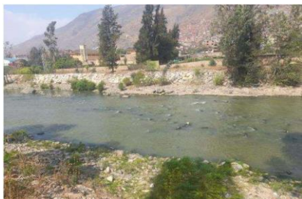
Fotografía del río Huallaga colmatada con piedras y palos producto del arrastre en temporada de avenida, con necesidad de intervención.