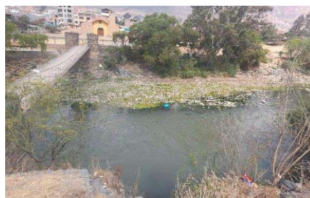
Fotografía del río Huallaga colmatada con piedras y palos producto del arrastre en temporada de avenida, con necesidad de intervención.